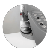
Cabezal de aluminio retráctil