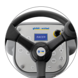
Panel de mandos con pantalla