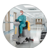
Función en modalidad silenciosa