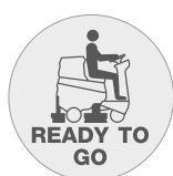
Función "Ready to go"