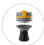
Ultra FilteRing System