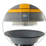
PTFE Kartuschenfilter (KLASSE M)