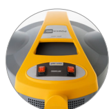
Einschalter (zwei motoren)