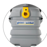
Behälter aus extrem widerstandsfähigem und schlagfestem Kunststoff