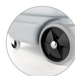
Schwenkräder und räder hinten mit großem Durchmesser