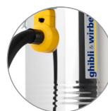
Fusto in acciaio resistente e duraturo