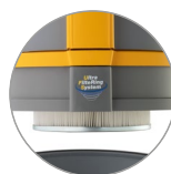
Filtro cartuccia in PTFE (classe M) sempre installato