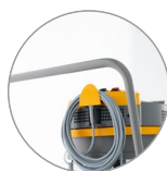
Dispositivo sostegno cavi