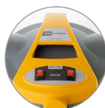
Pulsanti azionamento due motori