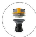
Ultra FilteRing System