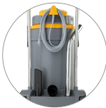
Kabelhalterung und zubehör holder