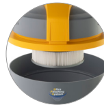
PTFE Kartuschenfilter (KLASSE M)