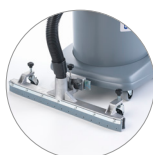
Barra di aspirazione (optional)