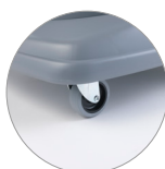
Ruote anteriori pivotanti