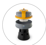
Ultra FilteRing System