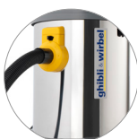
Fusto in acciaio resistente e duraturo