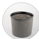
Filtro in TNT (optional)