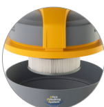
Filtro cartuccia in PTFE (classe M) sempre installato