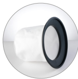
Filtro de tela