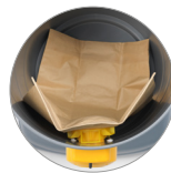
Filtro de manga de papel (opcional)