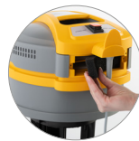
Salida y entrada de aire refrigeración motor