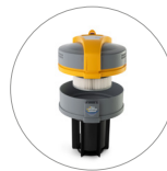
Ultra FilteRing System