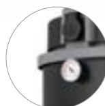
Manometro (nella versione M)