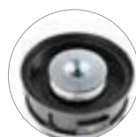
Filtro cartuccia ad alta efficienza (classe M)