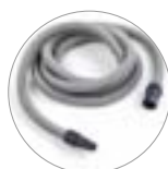
Tubo flessibile per utensile elettrico