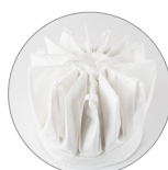
Filtre Étoile polyester antistatique