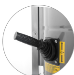
Secoueur de filtre manuel