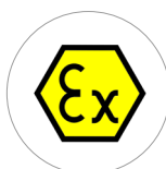
Certification ATEX 22 - II 3 D Ex tD IIIB T135°C X IP55 Dc