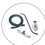
Large gamme d'accessoires antistatiques