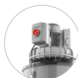
Silencieux et puissant