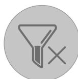
Contrôle de colmatage des filtres