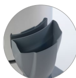
Grande bouche de chargement du réservoir