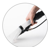
Embout manuel injection-extraction