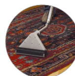
Idéal pour toutes les surfaces