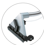
Embout sol injection-extraction en aluminium (en option)