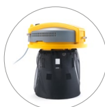
Filtre de protection en nylon