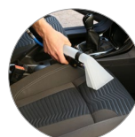
Komfort und einfache Bedienung