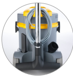
Dispositif de support pour les accessoires