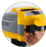
Entrée et sortie air refroidissement moteur