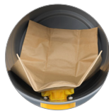
Sac filtre en papier (en option)