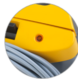
Témoin sac à poussière plein