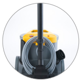
Dispositif de support pour les accessoires et le câble