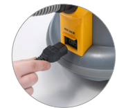
Prise pour brosse électrique