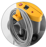
Câble d'alimentation amovible de 15 mètres