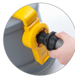
Raccord tuyau à baïonnette