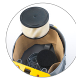
Filtre protection moteur et filtre à cartouche