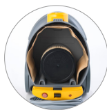
Behälter mit großem Fassungsvermögen