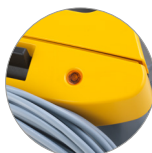
Indicador para "Bolsa polvo llena"