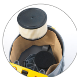
Filtro protección motor + filtro de cartucho