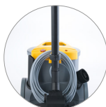
Racores tubo posterior