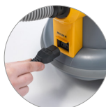
Acople para cepillo de potencia