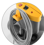
Cable desenganchable de 15 metros