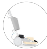
Spray system (optional)