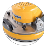
Möglichkeiten Zusätzliches Gewicht (6,5 und 13 Kg - optional)