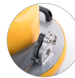
System für die blockierung des kopfes