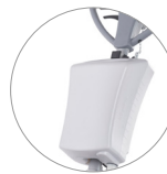
Reinigungsmitteltank 12 l (optional)