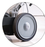
Nicht markierende Räder