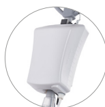
Depósito de 12 l (opcional)