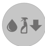
Menor gasto de agua y detergente