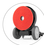
Amplia gama de pads