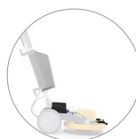
Spray system (opcional)