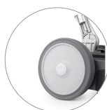
Ruedas no deja huella