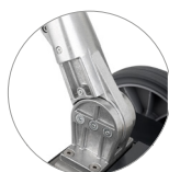
Articulación de la palanca