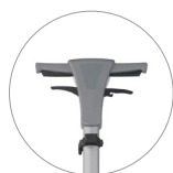
Empuñadura (vista frontal)