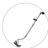
Алюминиевая насадка для пола (опция)