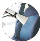
Idéal pour toutes les surfaces