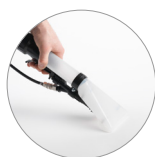
Buse manuelle injection-extraction