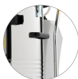
Réservoir solution nettoyante