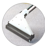
Boquilla para suelos