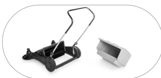
Контейнер для мусора большой емкости