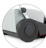
Grandi ruote posteriori