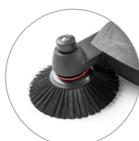
Spazzole laterali regolabili in altezza