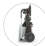
Dimensioni compatte: facile da riporre