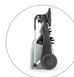
Dimensions compactes: facile à ranger