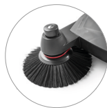
Cepillos laterales de altura regulable