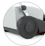
Ruedas posteriores de gran diámetro