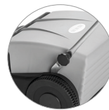
Sistema de bloqueo de la manija práctico y rápido