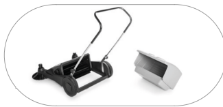
Contenedor de residuos de gran capacidad