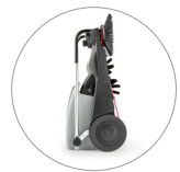
Dimensiones compactas: fácil de guardar