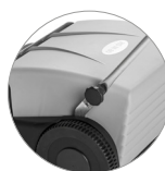
Sistema de bloqueo de la manija práctico y rápido