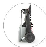
Dimensiones compactas: fácil de guardar