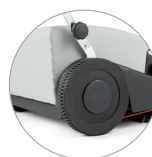
Ruedas posteriores de gran diámetro