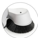
Кронштейн для левой боковой щётки (версии LSB)