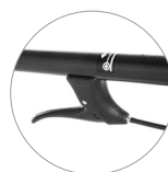
Механический рычаг активации тяги