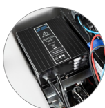
Встроенное зарядное устройство (версии BC)