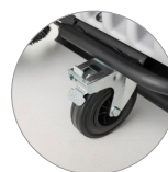
Поворотные колеса с тормозом