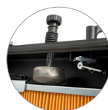
Ручной встряхиватель фильтра