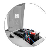
Легкий доступ для обслуживания