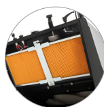
бумажный фильтр: Большая емкость фильтрации