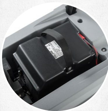
KIT HYBRID (2 ORE DI AUTONOMIA E 1 ORA DI CARICA)