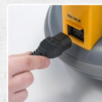
ACOPLE PARA CEPILLO DE POTENCIA