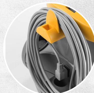
CABLE DESENGANCHABLE DE 15 METROS (EQUIPAMIENTO ESTÁNDAR)