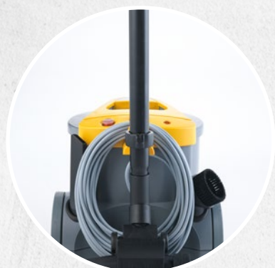
RACORES TUBO POSTERIOR