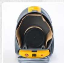
DEPÓSITO DE GRANDES DIMENSIONES