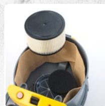
FILTRO PROTECCIÓN MOTOR + FILTRO DE CARTUCHO HEPA