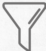
DREIFACHES FILTERSYSTEM PAPIERBEUTEL + STOFFBEUTEL ODER PATRONE + LUFTFILTER AM AUSGANG