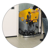
Tergitore regolabile e compatto