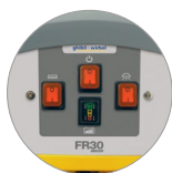
Panneau de commandes