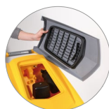
Debris tray + filtre de protection du moteur d'aspiration