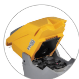
Sistema de depósito abatible