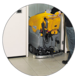
Einstellbarer und kompakter Saugbalken