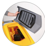
Sammelfilter für große Unreinheiten + Schutzfilter des Saugmotors