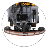
Système d'essuyage réglable...