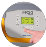
Fonction mode silencieux