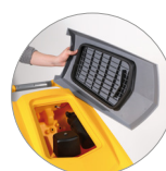
Filtro recogedor de partículas grandes + filtro motor de aspiración