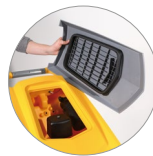
Sammelfilter für große Unreinheiten + Schutzfilter des Saugmotors