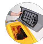
Sammelfilter für große Unreinheiten + Schutzfilter des Saugmotors