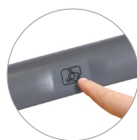
Сенсорная система управления