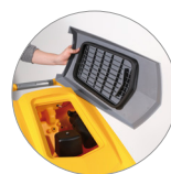
Фильтр для крупного мусора