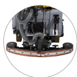
Регулируемая всасывающая балка и компактная