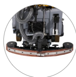
Tergitore regolabile ... ... e compatto