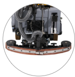
Secador regulable y compacto