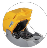
Sistema de depósito abatible