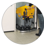
Filtro recogedor de partículas grandes + filtro motor de aspiración