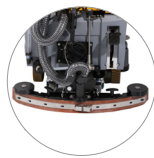
Einstellbarer und kompakter Saugbalken