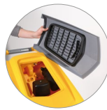
Sammelfilter für große Unreinheiten + Schutzfilter des Saugmotors