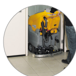
... y compacto