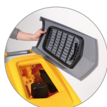
Filtro recogedor de partículas grandes + filtro motor de aspiración