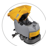
Sistema de depósito abatible