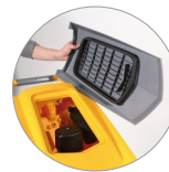
Sammelfilter für große Unreinheiten + Schutzfilter des Saugmotors