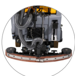
Tergitore regolabile e compatto