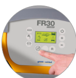
Funzione modalità silenziosa