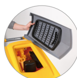
Filtro recogedor de partículas grandes + filtro motor de aspiración