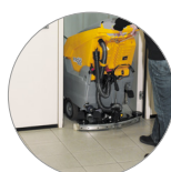
... y compacto