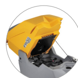
Sistema de depósito abatible