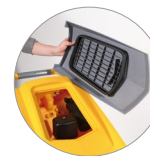
Sammelfilter für große Unreinheiten + Schutzfilter des Saugmotors