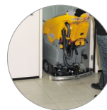
...und kompakter Saugbalken