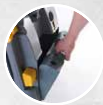
ESTUCHE DE BATERÍAS LITHIUM 24V 560 WH (Para versión 20 Ah) cod. 22.0571.01