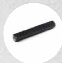
PORTA PADS CILÍNDRICOS cod. 40.5000.06