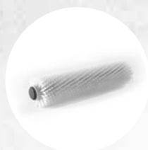
CEPILLO CILÍNDRICO DE POLIPROPILENO (SUAVE)