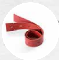
KIT DE GOMAS EN PARA (frente+detrás) cod. 96.0085.00