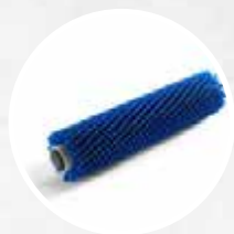
CEPILLO CILÍNDRICO DE POLIPROPILENO AZUL cod. 40.5000.00