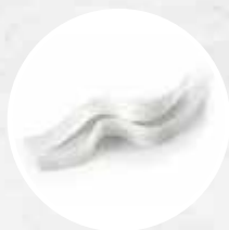
GOMAS DELANTERAS/ TRASERAS EN POLIURETANO (frente+detrás) cod. 96.0084.00