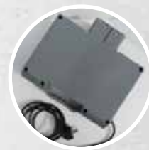
KIT ESTUCHE ALIMENTADOR ELÉCTRICO 230 V Para transformar también los modelos de batería M33 en modelos de cable (estándar para versiones E) cod. 22.0509.00