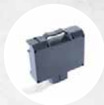
ESTUCHE DE BATERÍAS LITHIUM 24V 280 WH (Para versión 10 Ah) cod. 22.0571.00