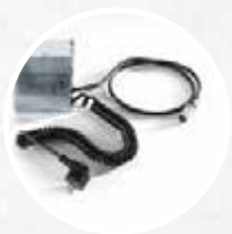
CARGADOR 24V 10 A cod. 22.0619.01