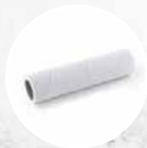
PAD CILÍNDRICO MELAMINA cod. 40.5000.10