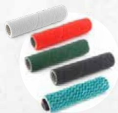
PADS DE MICROFIBRA BLANCO cod. 40.5000.11 ROJO cod. 40.5000.12 VERDE cod. 40.5000.13 NEGRO cod. 40.5000.14 MICROFIBRA cod. 40.5000.04**