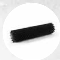
CEPILLO CILÍNDRICO TYNEX GRIT 80 cod. 40.5000.08