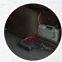
CARGADOR AUTO 24-12V 3A cod. 18.0065.00