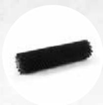
CEPILLO CILÍNDRICO TYNEX GRIT 360 cod. 40.5000.03