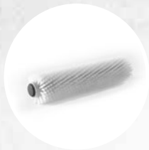
ZYLINDRISCHE BÜRSTE AUS POLYPROPYLEN (SOFT)