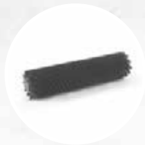
ZYLINDRISCHE BÜRSTE AUS POLYPROPYLEN (HARD)