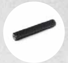
ZYLINDRISCHE PADS TREIBTELLER cod. 40.5000.06