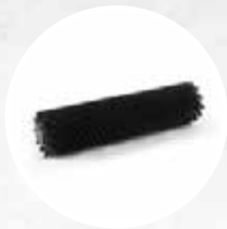
ZYLINDRISCHE TYNEX-BÜRSTE GRIT 360 cod. 40.5000.03