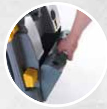
KOFFER FÜR BATTERIEN LITHIUM 24V 560 WH (Ausführungen 20 Ah) cod. 22.0571.01