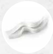
SAUGLIPPEN VORNE/HINTEN AUS POLYURETHAN (hinten/vorne) cod. 96.0084.00