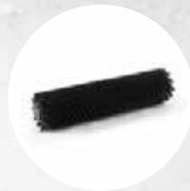
ZYLINDRISCHE TYNEX-BÜRSTE GRIT 80 cod. 40.5000.08