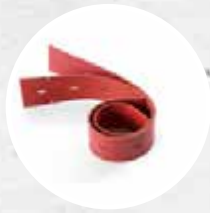
SATZ SAUGLIPPEN PARA (hinten/vorne) cod. 96.0085.00