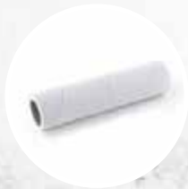
MELAMIN ZYLINDRISCHE PAD cod. 40.5000.10