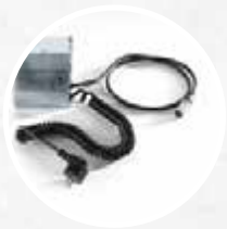
LADEGERÄT LI FE P04 24V 10 A cod. 22.0619.01