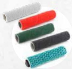
ZYLINDRISCHE PADS WEISSE cod. 40.5000.11 ROT cod. 40.5000.12 GRÜN cod. 40.5000.13 SCHWARZ cod. 40.5000.14 AUS MIKROFASER cod. 40.5000.04**