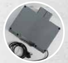
SATZ KOFFER MIT ELEKTRISCHEM LADEGERÄT 230 V Damit können auch die batteriebetriebenen Modelle M33 in Modelle mit Stromkabel verwandelt werden. (mitgeliefertes für ausführungen E) cod. 22.0509.00