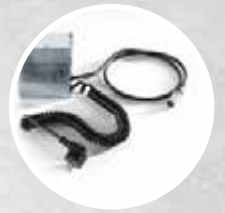
LADEGERÄT 24V 5 A (Ausführungen BC) cod. 22.0619.00