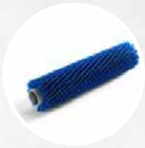
ZYLINDRISCHE BÜRSTE AUS POLYPROPYLEN, BLAU cod. 40.5000.00