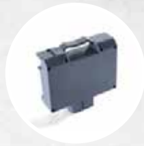
KOFFER FÜR BATTERIEN LITHIUM 24V 280 WH (Ausführungen 10 Ah) cod. 22.0571.00