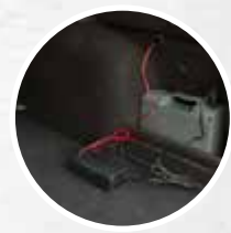
LADEGERÄT AUTO 24-12V 3A cod. 18.0065.00