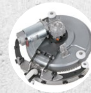
Tergitore e rotazione (fino a 270°)