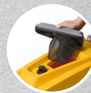
Coperchio removibile + galleggiante + filtro