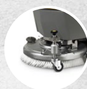
Ruotino esterno, regolazione in altezza