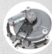
Tergitore e rotazione (fino a 270°)