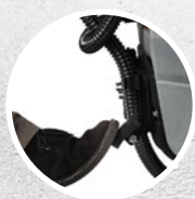
Sollevamento tergitore a pedale