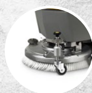
Ruotino esterno, regolazione in altezza

Hybrid: il sistema innovativo che associa l'alimentazione elettrica a quella a batteria (batterie al litio, fino a due ore di autonomia e un'ora circa di ricarica) in grado di garantire il perfetto mix tra performance, autonomia di utilizzo e sessioni di lavoro prolungate.