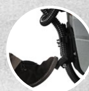
Sollevamento tergitore a pedale